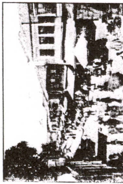
KAPAK: Fatos Gencosman KAPAKTAKİ FOTOGRAF: Üsküdar'da bir sokak. (Abdullah Frères, yaklaşık 1890)